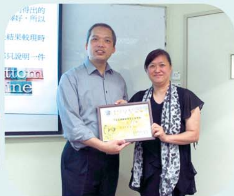
「淺談調解的智慧」工作坊