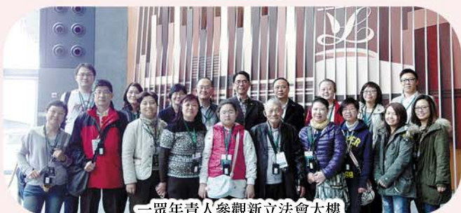
二眾年青人參觀新立法會大樓