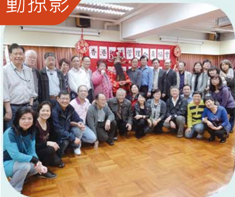
新春團拜祝願蛇年好運