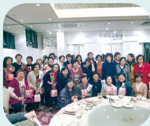
雅妍社一眾姐妹慶祝婦女節

舉辦多場講座及工作坊：內容包括海事、物流運作、了解空運業前景及調解等，反應熱烈。