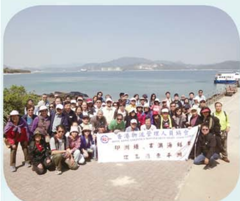
暢遊印洲塘、吉澳及東平洲