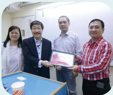
綜合性物流解決方案工作坊

舉辦多場講座及工作坊：內容包括海事、物流運作、了解空運業前景及調解等，反應熱烈。