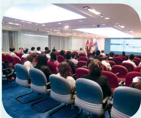
商業和物流業的雙贏