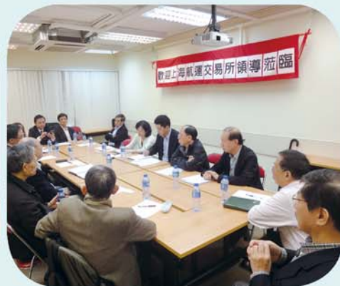
上海航運交易所到訪香港