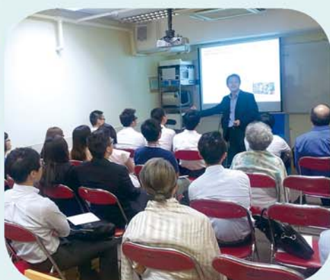
如何面對香港空運業的新挑戰