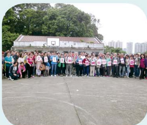
遊覽九龍寨城及沙頭角