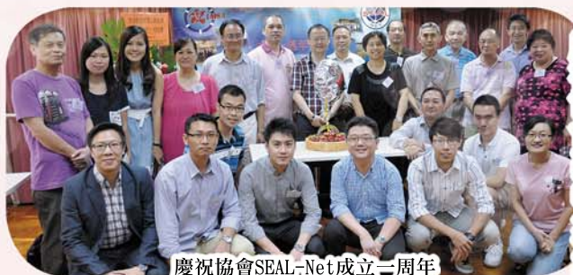
慶祝協會SEAL-Net成立二周年