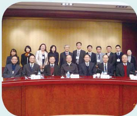
與業界團體一同前赴上海參觀交流